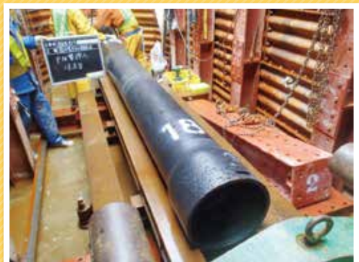
◀ J R 信越線 袋町踏切の耐震管布設工事の様子