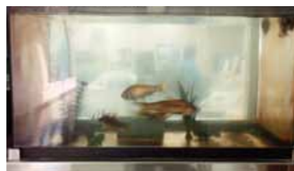
沈んで処理をした水