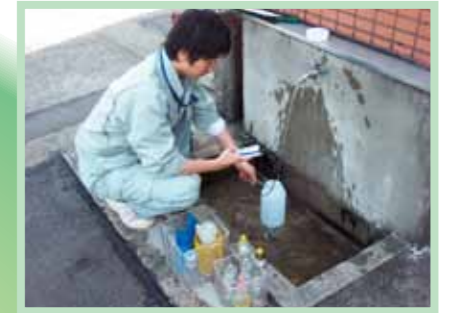
じゃ口水質検査の採水の様子