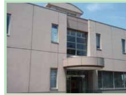
水質検査センター

水道局では、安全でおいしい水をお届けするために、水源から給水栓(じゃ口)まで、水質を厳しく監視しています。市内各地を定期的に回って、現地で調査・採水し、その水を水質検査センターで詳しく検査しています。また、色、にごり、消毒の残留効果の有無については毎日検査しています。