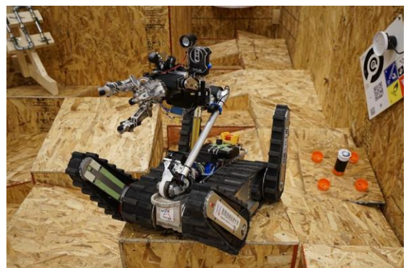
▲Nexis-R (長岡技大) レスキューリーグ 世界大会 2017年8位、2018年3位