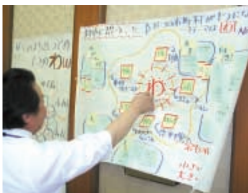
気に入ったキーワードに投票しました