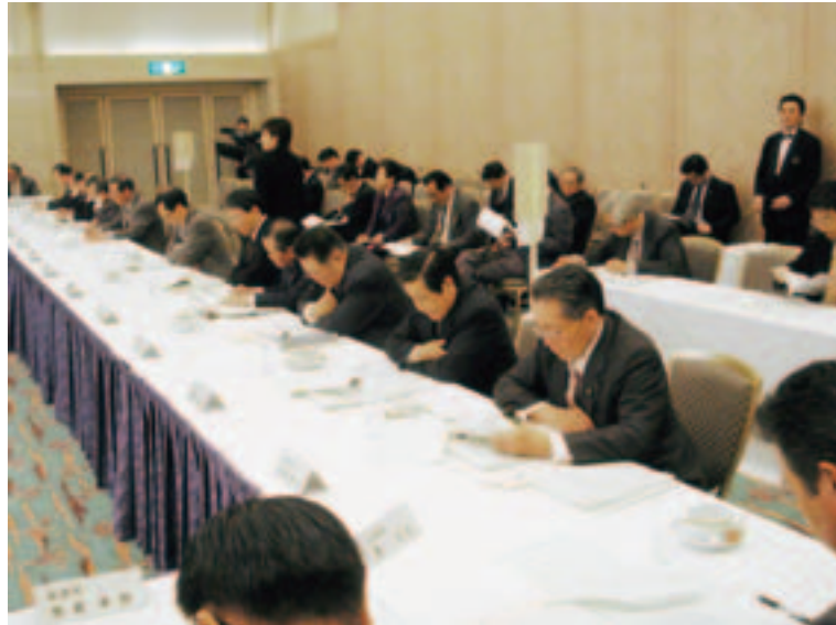
表3のとおり承認されました。