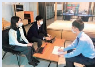
▲起業相談などはNaDeC BA SEで先行実施中

5階の産業フロアでは、専門家による経営・技術相談や起業支援が充実。社会のニーズに対応したプロジェクトへの挑戦や経営課題の解決など、経営者や起業家に寄り添って事業の成長・発展をサポートしていきます。