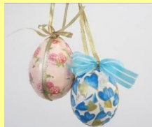
卵の殻で作った香り玉→