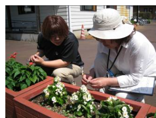
▲ベゴニアの雌花と雄花の違いについて実物を見ながら説明