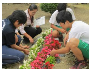
▲先生や生徒へ花壇に植え付ける間隔についてアドバイス

長岡市花いっぱいコンクール参加団体に対して、花づくりの悩みなどにお答えする現地指導を実施しています。現地指導は7月中旬まで行われ、団体は9月に活動の成果をまとめた作品を提出、その後10月に審査を行います。