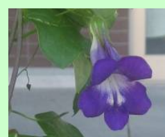
鐘形の花が長期間楽しめる「アサリナ」