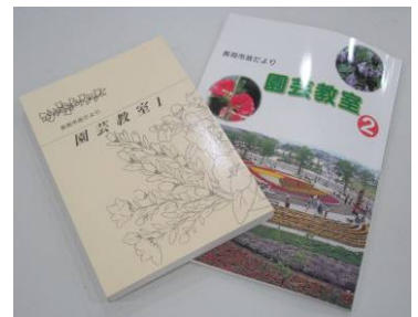
▲園芸教室1巻・2巻(各1,000円)

冬は園芸作業の少なくなる季節です。この時期は、こたつに入りながら今年の花づくり計画を立てるチャンス！緑花センターでは、市発行の園芸冊子を販売中。種苗メーカー(3社)のカタログもご覧いただけます。