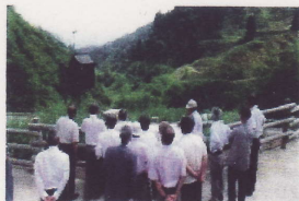
(訪問者から運賃徴収) (レンタル料の徴収)