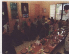
(地域資源を活用した旅行 プランの企画・販売) (バスを移動手段に利用)

市民とNPO法人が協働して、 生活サービスの継続性確保及び 地域活性化の取り組みを総合特 区による規制緩和も活用して進 める。