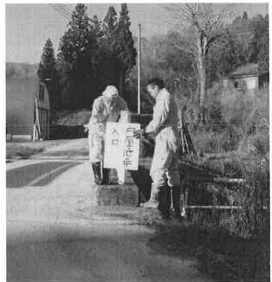
看板の取り外し（11月28日）