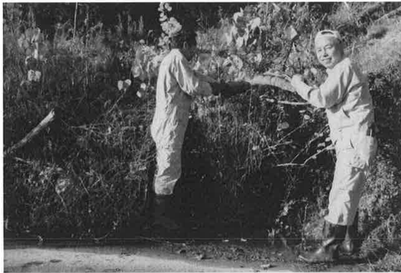
山道の整備状況（雑木除去）（11月14日）