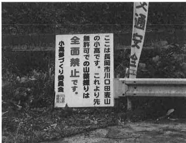
大型看板設置状況（3ヶ所）（7月11日）