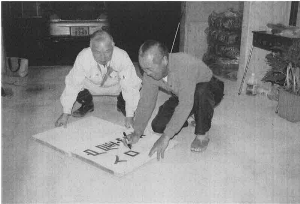
手作り看板作成状況（7月11日）