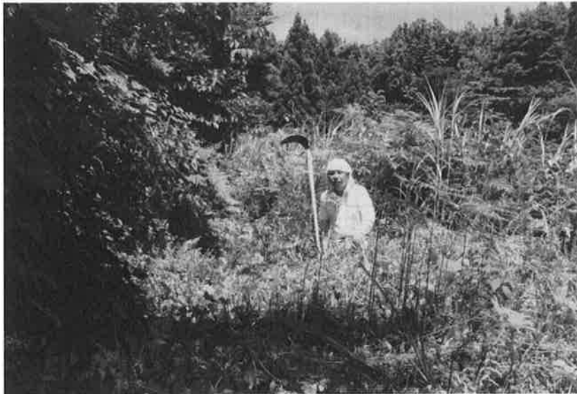
山道の整備状況（草刈）（7月18日）