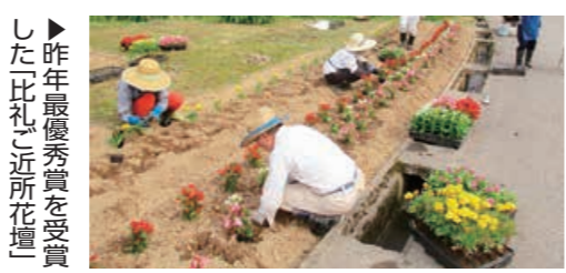
▶昨年最優秀賞を受賞した「比礼」近所花壇

◆図や表などの略字の見方は11ページ ◆図どなたでも、図特になし、図無料、図不要(直接会場へ)の場合は、記載なし ◆図に電話、ファクス、Eメール、図(市ホームページ)の記載がある場合は、その方法で申し込み可 アオ=アオーレ長岡 市セ=市民センター 大手=大手通庁舎 さい=さいわいプラザ