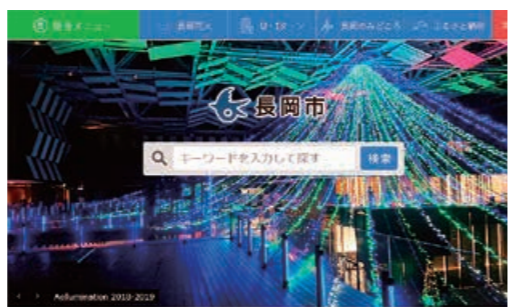
▲広告を掲載するトップページ

募集数=18枠 掲載期間=4月～来年3月(1カ月単位) バナー広告規格=縦60×横120ピクセル。GIF、JPEG、PNGで容量4KB以内(静止画のみ) 月2万円(一括前納。掲載期間中の取り下げなどに伴う返金はしません) 掲載位置=トップページ ①2月12日(火)～3月11日(月)に広報課 ☎39・2202へ ※詳しくは市ホームページをご覧ください