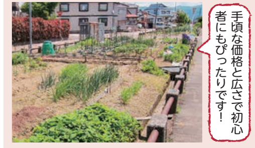
手頃な価格と広さで初心者にもぴったりです！

②菜園きぼう(希望が丘2・3丁目) 時4月から3年間 ④115区画(抽選1区画20㎡) 月1区画年2,000円 ⑤2月15日(金)(必着)までに往復はがきの往信の裏に「菜園きぼう利用申込」、郵便番号、住所、氏名(ふりがな)、電話番号、返信の表に自分の宛先を記入して〒940-0084幸町2-1-1市民協働課生涯学習係(☎39・2388)へ