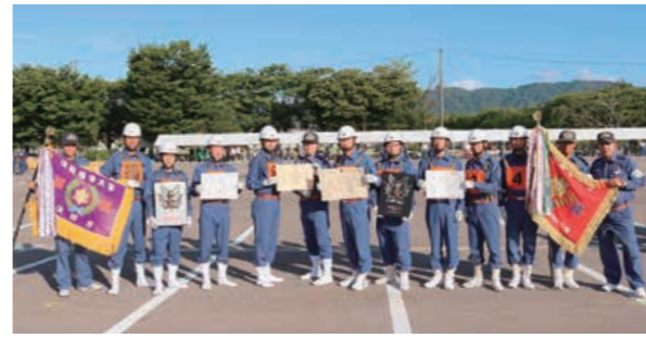
▲ダブル優勝を果たした長岡川西方面隊の2チーム

●日赤救急法基礎講習会 時10月13日(土)午後1時～5時 30分 ☎さいわいプラザ 15歳以上 定30人(先着) ☎1、