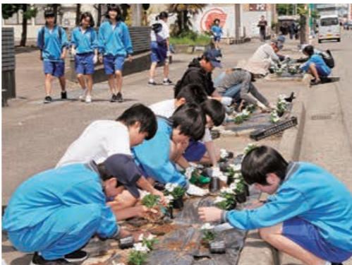
▲花いっぴいのまちづくりに参加する地域の子どもたち

街路花壇や公園など公共の場所で花を育てる町内会などの団体 申10月5日(金)までに、長岡地域の団体は緑花センター(花テラス) ☎39・8718、支所地域の団体は各支所産業建設課(栃尾支所は建設課)にある申込書で