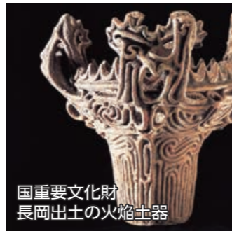
国重要文化財 長岡出土の火焰土器

磯田市長は「英国の大英博物館に展示した長岡の火焰型土器が、世界的に話題となっています。聖火台への採用を実現し、日本の和を発信しましょう」と呼び掛けました。 204 園政策企画課 ☎39・2