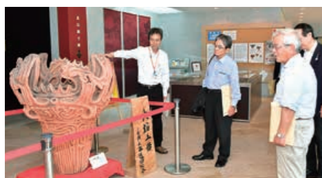
▲馬高縄文館を視察する宮田長官（左から2人目）と青柳前長官（右手前）