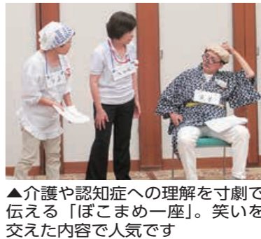
▲介護や認知症への理解を寸劇で伝える「ぼこまめ一座」。笑いを交えた内容で人気です

① ② いずれも 社会福祉協議会介護職員ほか 8月3日(金)から①与板支所市民生活課 ☎72・3190 ②川口支所市民生活課 ☎89・3112へ ②介護が楽になれる福祉用具の紹介 時 9月6日(木)午前10時～午後2時 場 地域包括支援センターかわぐち 定15人(先着)