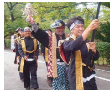
▲かつて同盟を結んだ会津で人気を集める長岡の隊列

●ながおかポニーカーニバルボランティア 時 9月30日(日)午前8時～午後5時 場 市民防災公園(長岡駅周辺からの送迎あり) ④