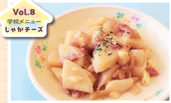
Vol.8 学校メニュー じゃがチーズ