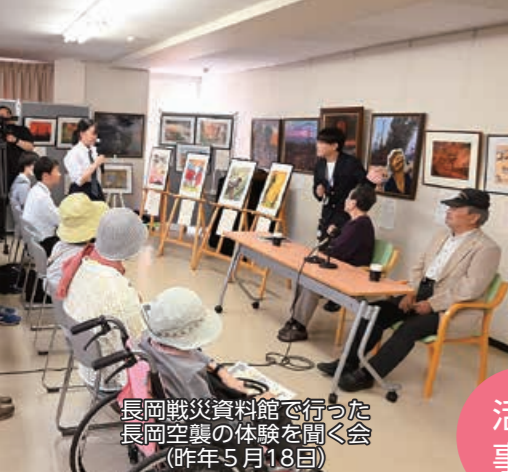
長岡戦災資料館で行った長岡空襲の体験を聞く会(昨年5月18日)