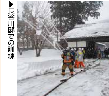
長谷川邸での訓練

1月26日は文化財防火デー 地域住民や消防団、消防隊による火災防訓練などを行います。 ①1月21日(日)午前9時～10時 ②午前9時～10時30分 ③1月24日(水)午前9時30分～10時30分 場 ①長谷川邸(塚野山) ②貴渡神社(枳堀) ③良寛の里(ましま歴史民俗資料館) ④長岡消防署越路出張所 ☎92・6519 ⑤栃尾消防署 ☎52・1155 ⑥与板消防署 ☎72・2572