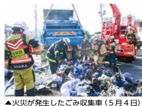
▲火災が発生したごみ収集車(5月4日)

窓口に来るのは、新しいパスポートを受け取る1回だけ！必ず古いパスポートを持ってきてね。