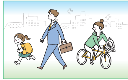
徒歩や自転車での通学・通勤