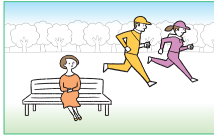
散歩やランニング