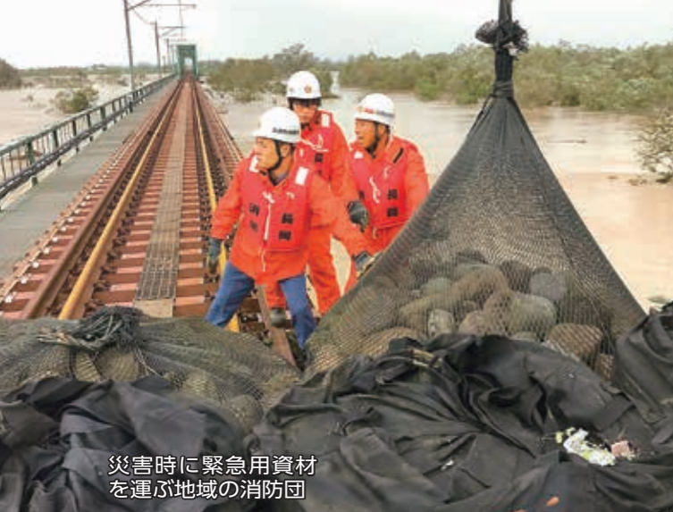
災害時に緊急用資材を運ぶ地域の消防団