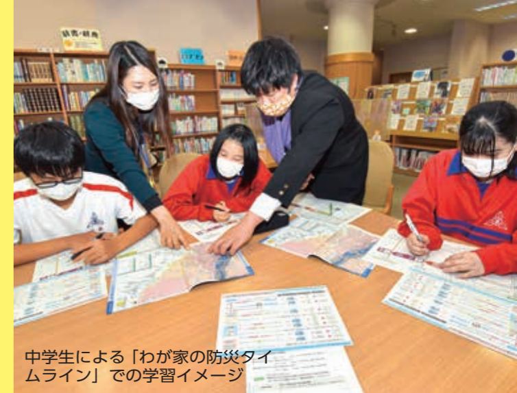
中学生による「わが家の防災タイムライン」での学習イメージ

家族やご近所、学校の友達と日ごろから会話をし、災害時には助け合うことが肝心です。一人ひとりの声掛けが、多くの人の避難につながります。