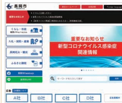
▲広告を掲載するトップページ

募集数=18枠 掲載期間=4月~来年3月(1カ月単位) バナー広告規格=縦70×横180ピクセル。GIF、JPEG、PNGで容量20KB以内(静止画のみ) 月2万円(一括前納。掲載期間中の取り下げなどに伴う返金はしません) 掲載位置=トップページ 3月5日(金)までに広報課(アオ)39・2202へ ※詳しくは市ホームページで