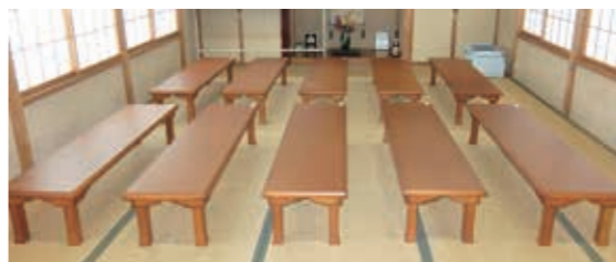
▲吉津町内会のテーブル

国のシステムが停止するため、マイナンバーに関する業務を上記日程で休業します。ご理解、ご協力をお願いします。 ☎市民課アオ ☎39・7514