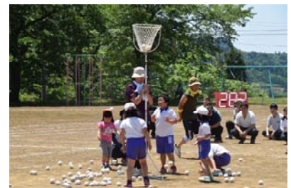
▲昨年の「玉入れ」の様子