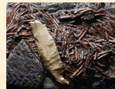
土器片・石器と珍しい漆紐