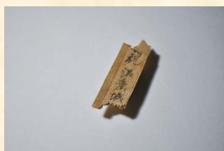
「沼垂城」と書かれた木簡