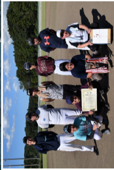
二連覇されたピピンキース☆のみなさん 準優勝は、猿舞蘭でした。