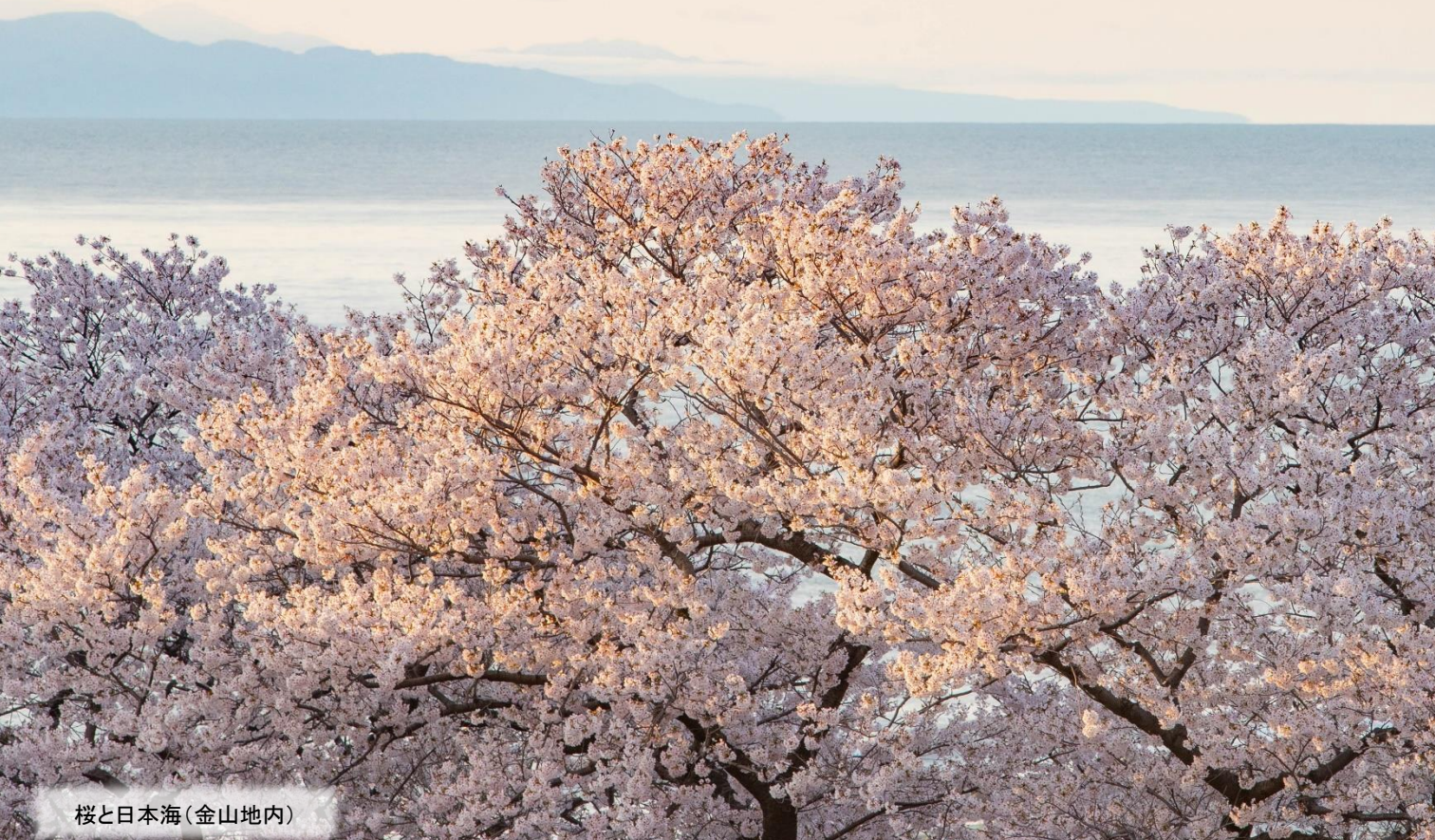
桜と日本海(金山地内)