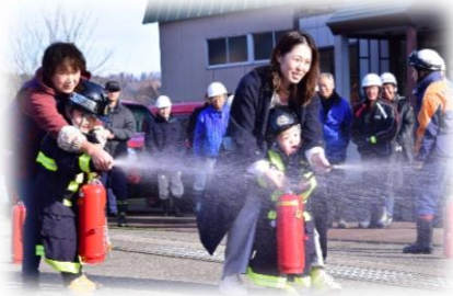
↑ 昨年の訓練の様子