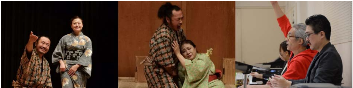
※稽古風景の様子(9月から稽古実施)

問い合わせ：(公財)長岡市芸術文化振興財団 殖粟 TEL 0258-29-7715