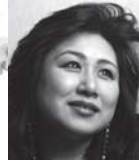
五十嵐郊味 (月見草の嫁)