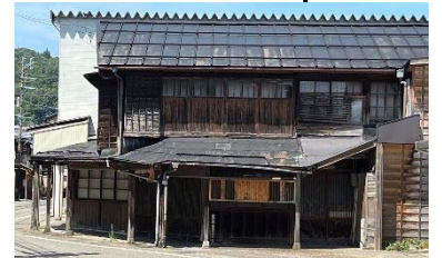
▲武者隠し(栃尾表町)