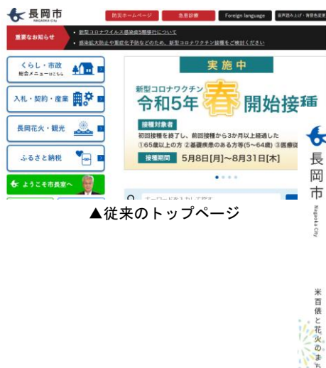
▲従来のトップページ

3 URL https://www.city.nagaoka.niigata.jp/