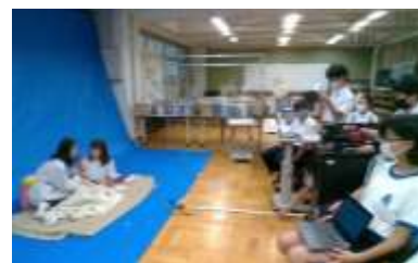
▲短編映画製作の様子