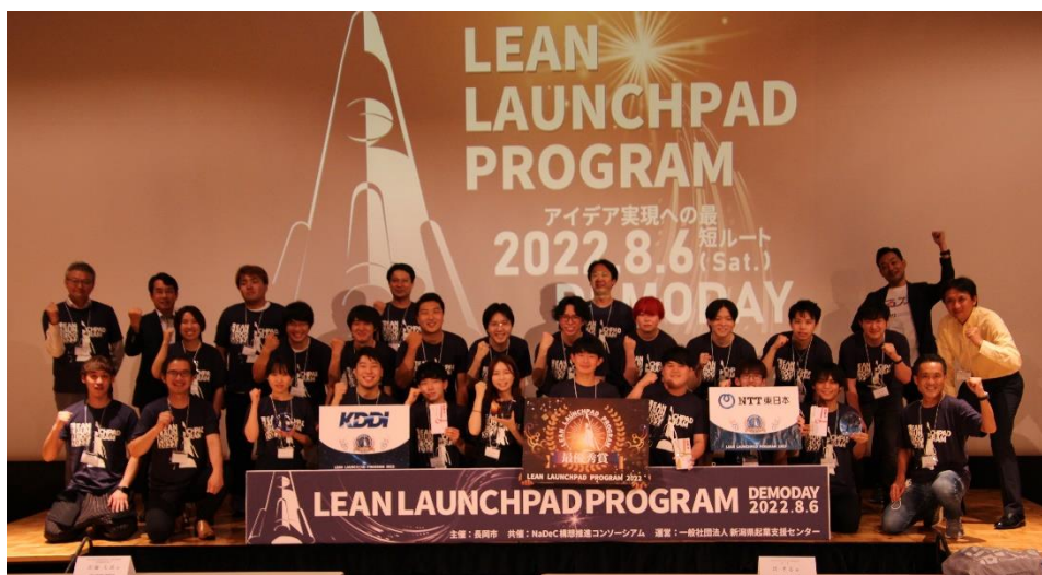
〈令和4年度 DEMO DAYの様子〉