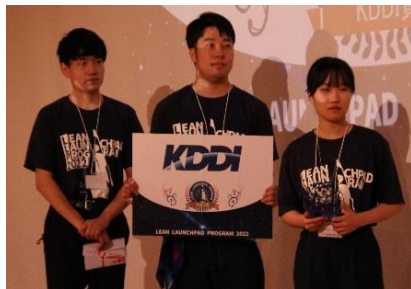
〈KDDI賞:CAR in 話〉