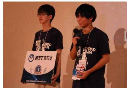
〈NTT 東日本賞:華じまい〉