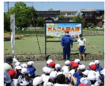
▲一昨年の開田式の様子