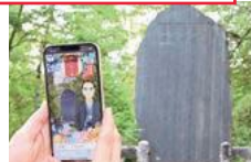
ARで学ぶ石碑めぐり

面積8,000㎡の広場。花見のシーズンとなると、桜の木の下に腰を下ろし、多くの人たちが美しい桜に酔いしれる。桜まつり期間中は自由広場周辺にたくさんの屋台が並び、