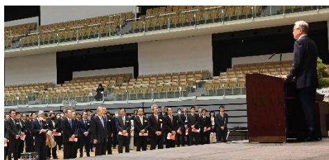
各界のトップが集まる市内最大の催し