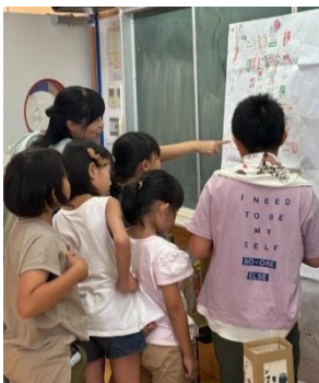
地元を発信すること、絵を描くことが大好きな上組小3年生