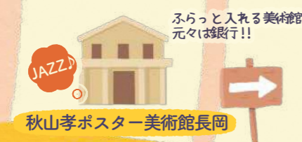
秋山孝ポスター美術館長岡