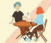
上組小 50 台