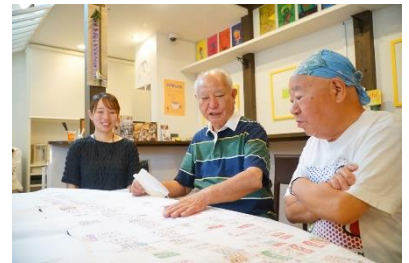
地域の大先輩からまちの思い出を聞く茶話会は毎回盛り上がりました。