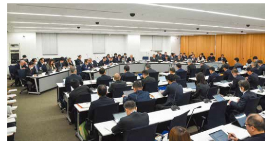
議員協議会の様子

議員協議会を開催し、令和8年度当初予算(案)および持続可能な行財政運営について市から説明がありました。具体的には、当初予算に係る重点施策が示されたほか、「持続可能な行財政運営プラン」、「公共建築物適正化計画 第2期計画」、「水道事業経営戦略」について説明を受け、質疑や意見交換を行いました。