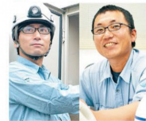
南橋の上車メーカー、大原重工との関連会社です

「電気」の安定供給を支え続けて70年。私たちの仕事の9割は東北電力と官庁から発注のインフラ整備です。転勤なし、地元・長岡で安心して長く勤めている電気エンジニアが活躍中です! 離職率の低さも当社の自慢です!