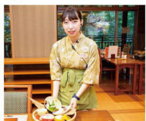
接客のアドバイスなど先輩が丁寧にサポートしてくれます

旅先ならではのモノやコトを通じてお客様の心に残る旅のお手伝いが私たちの仕事です。働くスタッフも明るく元気でいられるように、仕事における不安や悩みの解消、業務の指導、育成を年の近い先輩スタッフが担当するメンター制度を採用しています。