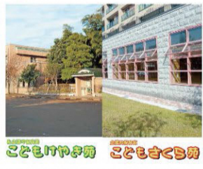
職場近くに保育施設を2ヶ所設置しています

長岡市を中心に高齢・保育・障がい者就労支援等を行っています。年齢層も幅広く約1360名の職員が在籍。研修制度・福利厚生等が充実しているのが特徴です。職場隣接の保育施設の設置など、スキルアップ&安心して勤められる環境が整っています。