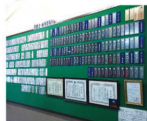
国家技能士・社内技能士・資格取得を応援

工業用ミシンの世界トップブランドJUKIのグループ企業で金属精密部品加工を生業としてアパレル業界が使用する刃物の種類と生産量で世界一の企業です。国家技能士、社内技能士を育成し各級ごとの技能士手当を給料以外に毎月支給、社員のスキルアップを推奨しています。