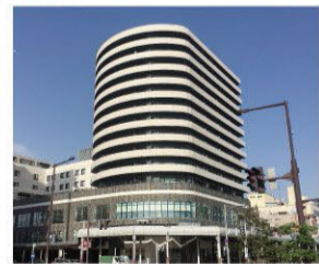
ナースingホームメッツ大手(長岡駅近の施設)

長岡市内で三棟、高齢者向けの施設運営をしています。この仕事は常に学びが大切!「選択式研修」で自分の足りないところは重点的に補完し、得意なところは更に伸ばしていく!をモットーに、多くの社員が自主的に学びの選択をしています。