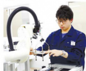
最先端ロボットと協働しながら効率的な生産現場を実現

アルミ電解コンデンサで世界シェアNo.1を誇る日本ケミコングループの一員として、車載向け電力再生モジュールやカメラモジュールの開発と生産を行っています。階層毎の研修制度を設け「人材」育成に力を注いでおり、福利厚生も充実しています。