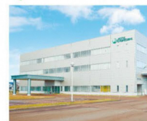
「24時間365日」温湿度管理された工場

プリント基板用露光装置で世界トップクラスのシェアを誇る当社では、スマートフォンなどの電子製品の進化に合わせて最先端の装置を開発・製造しています。「働きがいある職場」を目指し、時間管理や休暇制度など福利厚生面も充実した企業です。