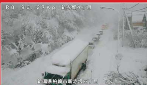
令和4年12月19日 国道8号(登坂不能車による交通障害の発生状況)