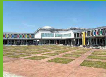
⑦ 道の駅ながおか花火館