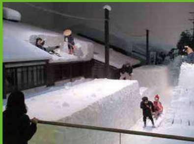
⑥ 新潟県立歴史博物館