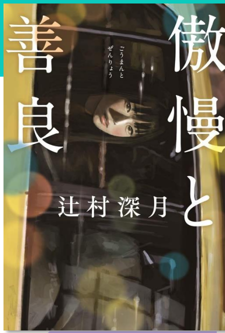
傲慢と善良 辻村 深月/著 朝日新聞出版/2022