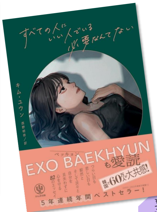
すべての人にいい人である必要なんてない つらい日も悲しい日も毅然として そして 淡々と 自分を見失わずに心を守る82の エッセイ キム・ユウン/著、西野 明奈/訳 かんき出版/2023