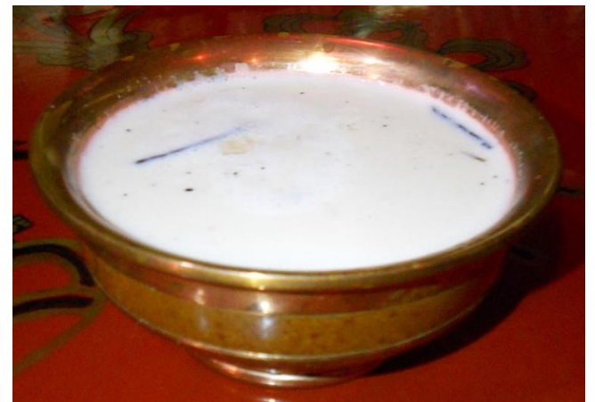
モンゴルのミルクティー

デ：はい。意味は「母が作ったお茶」。モンゴルのお茶の特徴と云えば、日本人は想像できないのか、ちょっと塩味のミルクティーなんですけど。私たちは子どもの時から飲んでいたので、本当に好きです。