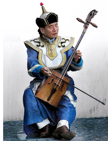
ばとうきん 馬頭琴

デ：そうですね。私 わたし ホーミー ひと する人 き から聞いた んですけど、ホーミーは練習 れんしゅう すればだれでも できるようになると聞 き きました。モンゴルの 西 にし に住 す んでいる人 ひと たちはほとんどみんな遊牧 ゆうぼく 民 みん ですね。みんなホーミーができます。