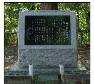
柿川戦災殉難地の碑