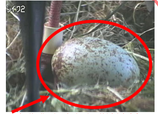
(炭緑色に褐色の斑紋模様)