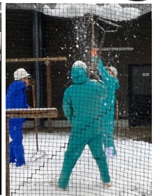
積った雪を落とします