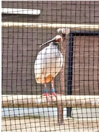
青い足環の「のずみ」です♪

トキの飼育ケージ内のネットが、雪の重みで大きく垂れ下がりがり U の字を書いたようになることがあります。ネットが破損する恐れやトキが飛んだ時に低くなったネットに衝突する危険があるため、飼育員が積もった雪の取り除き作業を