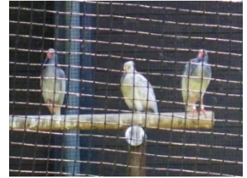
6/1 止まり木の端へ初めて歩き出した幼鳥(真ん中)と 尚脇に寄り添うゆう(右)とさくら(左)