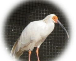
長岡にいた頃のNO.529とNO.531 <令和5年撮影>