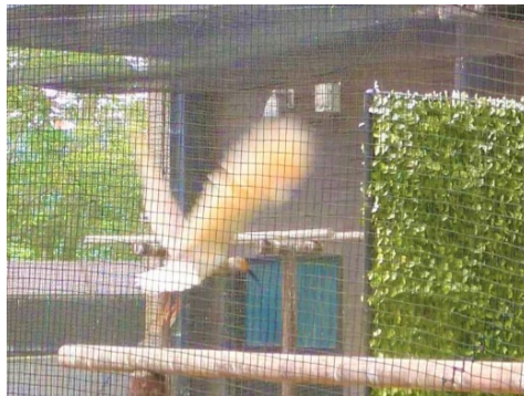
力強く羽ばたき飛び上がる幼鳥