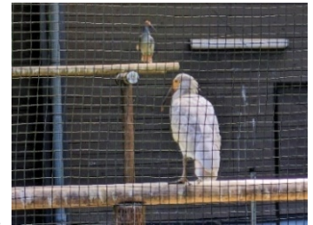
6/4 手前の止まり木へ初めて飛んだ幼鳥(手前)と 見守るゆう(奥)