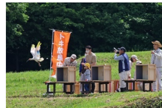
大佐渡地域・小野見地区 での放鳥の様子