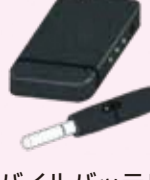
モバイルバッテリー 電子タバコ