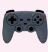
ゲーム機のリモコン