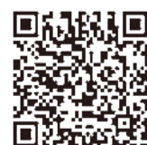
◀「おいくら」一括査定申し込み

不要品買い取り比較サイト「おいくら」は、簡単な入力ですべてのお店の買い取り価格を比較できます。