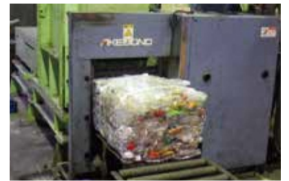
圧縮して再生事業者に出荷