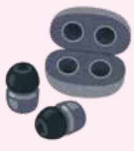
ワイヤレスイヤホン