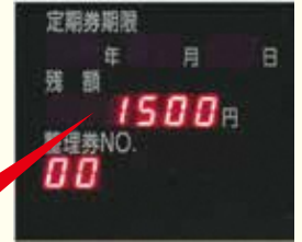
【カードリーダー表示】

正常な場合、“ピッ”と鳴り、青く 点灯します。 (赤く点灯した場合はエラーです。 もう一度タッチしてください)