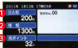
【運転席付近の表示画面】