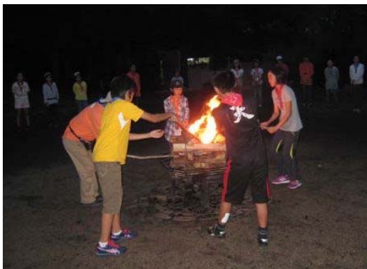
夏のつどい in 磐梯

毎年、実施計画をまとめ、広く市民の理解と協力を得て、家庭、学校、地域社会等がそれぞれ持つ教育的な機能を明確に認識し、関係機関と連携を図りながら、地域に根ざした総合的な青少年対策を推進することを目的としています。