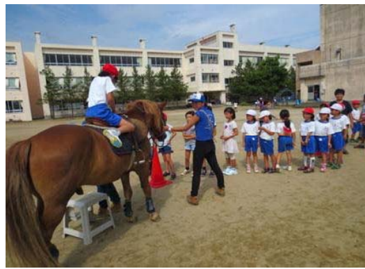
グラウンドポニースクール

※ 子ども・子育て支援法第61条の規定に基づく計画で、教育・保育及び地域子ども・子育て支援事業の提供体制の確保や業務の円滑な実施に関する事項を定める「市町村子ども・子育て支援事業計画」として策定しています。