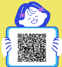
子どもの相談機関一覧