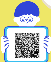
こころの健康相談