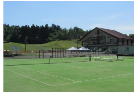
コート数2面(全天候型オムニコート)